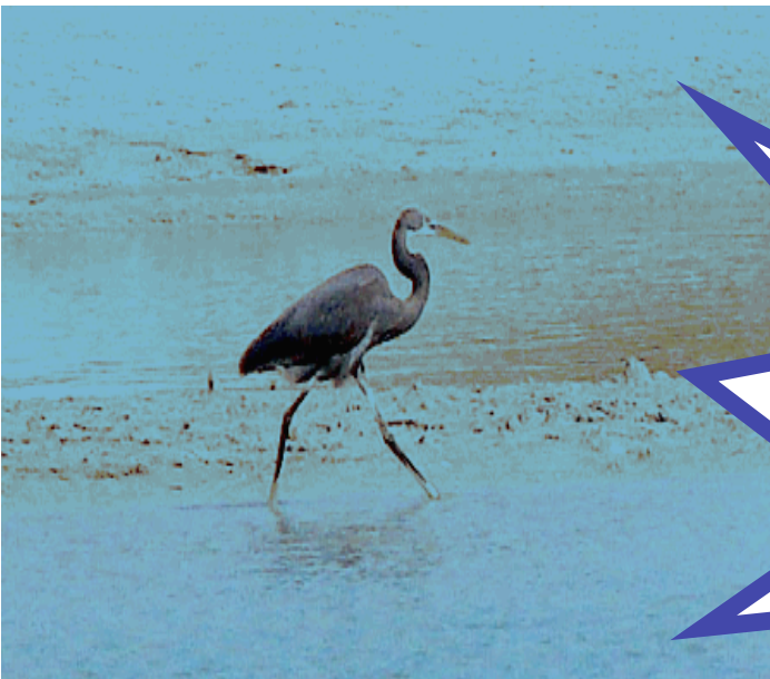
Un Héron Gris dans la Lagune